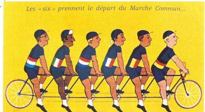
Affiche française de 1957 en faveur du marché commun