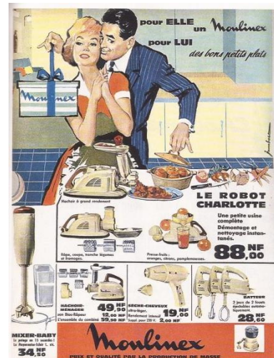
Une publicité des années 1950