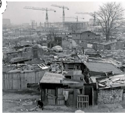
Bidonville à Nanterre, 1969. Au milieu du XX ème siècle, la plupart des logements n'avaient ni eau courante, ni WC, ni salle de bains, de nombreuses personnes vivaient encore dans des bidonvilles.