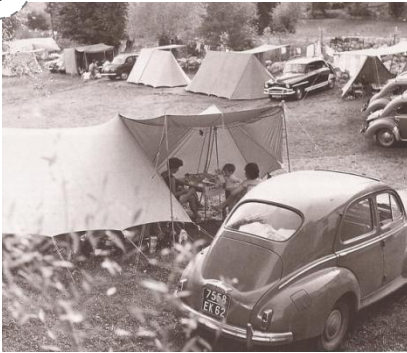
Les familles françaises en vacances en 1950