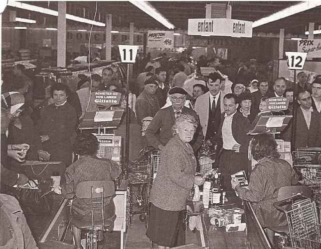
L'ouverture du premier hypermarché en France (Sainte-Geneviève-des-Bois, 15 juin 1963)