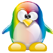
Celui qui lit